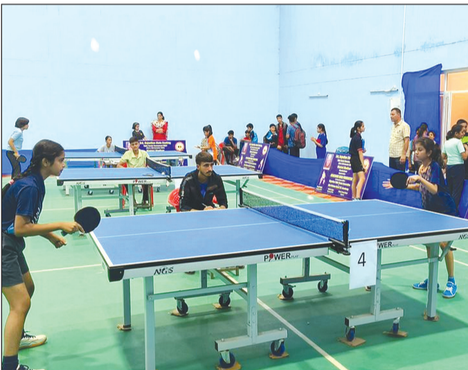
11-8, 5-11, 8-11, 11-5, 11-6 से हरा दिया। भारत के दुनिया के 42वें