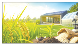
□ पीलीभीत में 7 एकड़ में विकसित होगा हाईटेक प्रशिक्षण केंद्र, जितिन प्रसाद ने एआई-आधारित बासमती सर्वे परियोजना का किया शुभारंभ

नयी दिल्ली। कृषि और प्रसंस्कृत खाद्य उत्पाद निर्यात विकास प्राधिकरण (एपीडा), और उत्तर प्रदेश सरकार के बीच 70 वर्ष के पट्टे समझौते पर हस्ताक्षर के माध्यम से पीलीभीत के टांडा बिजौरी में बासमती और जैविक प्रशिक्षण केंद्र-सह-प्रदर्शन फार्म की स्थापना के लिए भूमि हस्तांतरण को औपचारिक रूप दिया गया है। यहां जारी एक सरकारी विज्ञापित में यह जानकारी दी गयी है। इसमें बताया गया है कि इस प्रस्तावित फार्म को लगभग सात एकड़ क्षेत्र में विकसित किया जाएगा। इस केंद्र में सभागार, बासमती एवं जैविक खेती पर संग्रहालय और गैलरी, सम्मेलन कक्ष, प्रयोगशाला और जैविक खेती के लिए आवश्यक सामग्री के भंडारण की सुविधा उपलब्ध होगी। यह सुविधा बासमती एवं जैविक किसानों के प्रशिक्षण और क्षमता निर्माण में मददगार होगी और कृषि विशेषज्ञों