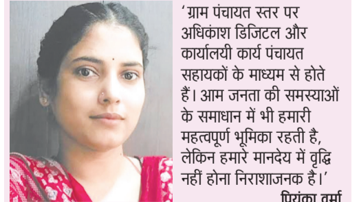
पंचायत सहायक, गांतोना, विकास खंड हैदरगढ़

अभिलेखों का रखरखाव, कार्यालयी कार्यों में सहयोग तथा आमजन की समस्याओं का समाधान जैसी महत्वपूर्ण जिम्मेदारियां उनके कंधों पर हैं। ग्राम पंचायत और ग्रामीण जनता के बीच समन्वय स्थापित करने में भी उनकी महत्वपूर्ण भूमिका रहती है। इसके बावजूद सुविधाओं और सम्मानजनक मानदेय के नाम पर उन्हें केवल आश्वासन ही मिलते रहे हैं। पंचायत सहायकों का कहना है कि सरकार की अधिकंश योजनाओं का डिजिटल क्रियान्वयन उन्हीं के माध्यम से होता है, लेकिन उनकी समस्याओं को सुनने वाला कोई नहीं है। वर्षों से पंचायत सहायक अपने मानदेय में वृद्धि और सेवा शर्तों में सुधार की मांग को लेकर संघर्ष कर रहे हैं। अब देखा जा रहा है कि ग्रामीण विकास की इस महत्वपूर्ण कड़ी की आवाज शासन-प्रशासन तक कब पहुंचती है और कब उन्हें उनके कार्य के अनुरूप सम्मान तथा उचित पारिश्रमिक मिल पाता है।