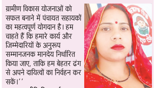
पंचायत सहायक, ओहरामऊ, विकास खंड हैदरगढ़