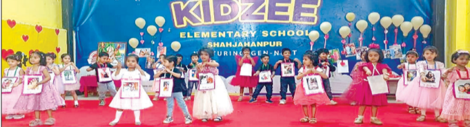
केनविज टाइम्स संवाददाता

शाहजहांपुर। किडजी एलीमेंट्री स्कूल में मदर्स-डे समारोह बड़े ही उत्साह, उमंग एवं हर्षोल्लास के साथ मनाया गया। कार्यक्रम का शुभारंभ सभी माताओं के स्वागत, तिलक एवं पुष्प अभिनंदन के साथ किया गया। इसके बाद रंगारंग सांस्कृतिक कार्यक्रमों की शानदार प्रस्तुतियां हुईं। सर्वप्रथम प्लेग्रुप के नन्हे-मुन्ने बच्चों ने आई लव माय मीमी गीत पर मनमोहक नृत्य प्रस्तुत किया। इसके बाद प्लेग्रुप की माताओं ने अपने बच्चों के साथ मेरे लिए तुम काफी हो गीत पर ग्रुप डांस प्रस्तुत किया। इसके बाद नर्सरी, जूनियर केजी आदि के बच्चों ने मां से संबंधित गीतों पर अपनी सुंदर प्रस्तुतियां कर सभी को भावुक कर दिया। जिसे सभी ने खूब सराहा। कार्यक्रम का मुख्य आकर्षण मदर् डांस प्रतियोगिता रही,