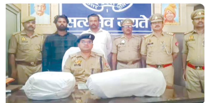
केनविज टाइम्स संवाददाता

लखीमपुर खीरी में 'नशा मुक्त अभियान' के तहत फरधान पुलिस और ड्रड्रड टीम ने संयुक्त कार्रवाई करते हुए दो अंतरजनपदीय शांति तस्करों को गिरफ्तार किया है। पुलिस ने इनके कब्जे से 10.135 किलोग्राम अवैध गांजा (चिम्पड़) बरामद किया, जिसकी कीमत करीब ₹1.5 लाख बताई जा रही है। गिरफ्तार आरोपी बुलेट मोटरसाइकिल (उच-34 उट्ट-