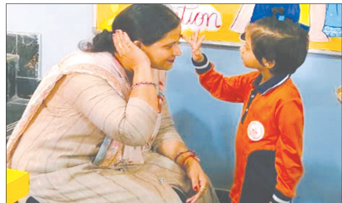
केनविज टाइम्स संवाददाता

इस सम्बन्ध में 9415901146 पर चीफ इंजीनियर द्वारा बताया गया कि स्मार्ट मीटर में रीचार्ज करने के बाद स्वतः चालू हो जाता है क्या दिक्कत हुई है इसकी जांच के लिए सम्बन्धित को निर्देश दिए गए हैं उपभोक्ताओं को किसी तरह की दिक्कत नहीं होगी।