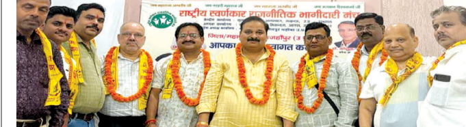
केनविज टाइम्स संवाददाता