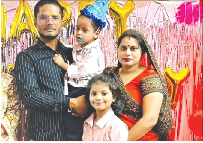
कैनविज टाइम्स संवाददाता

अधिकांसी अभियंता व मुख्यअभियंता के खिलाफ गैर इरादतन हत्या का केस दर्ज, तीन मासूम बच्चों के सिर से उठा-पिता का सायां