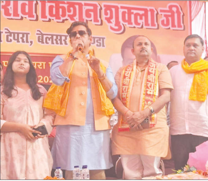
कि केंद्र व प्रदेश सरकार पायदान पर खड़े लोगों के हितार्थ किसानों, युवाओं, गरीबों व अंतिम लगातार कार्य कर रही है। उन्होंने कहा