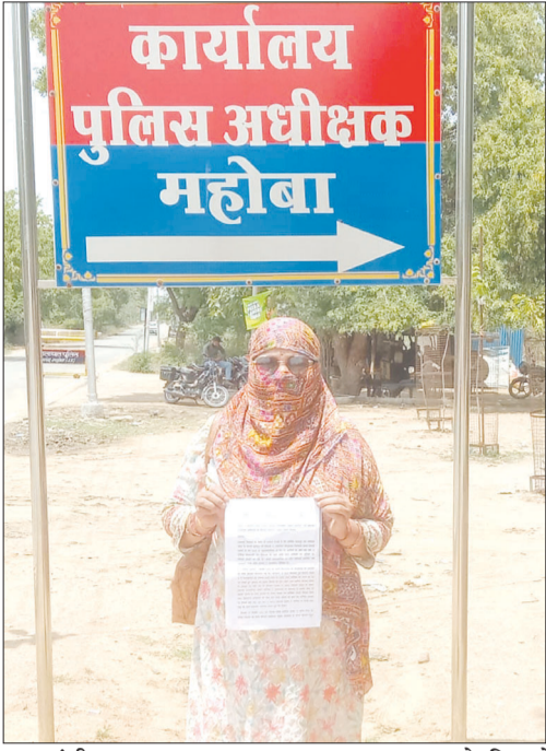
मुख्यमंत्री द्वारा राज्य अध्यापक पुरस्कार से सम्मानित हैं। 01 फरवरी 2025 को

जिला प्रशासन ने मामले की जांच के लिए तीन सदस्यीय समिति गठित की है। रविवार को जनपद मुख्यालय निवासी एक प्राथमिक विद्यालय की प्रधानाध्यापिका ने बताया कि वह