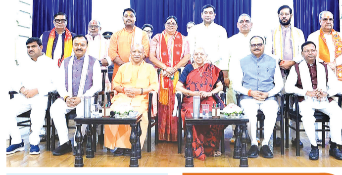
भूपेन्द्र चौधरी व मनोज पांडेय ने कैबिनेट मंत्री, चार को बनाया राज्य मंत्री दो राज्य मंत्रियों को स्वतंत्र प्रभार के रूप में मिला प्रमोशन

इन सभी मंत्रियों को राज्यपाल आनंदीबेन पटेल ने यहां जन भवन में एक सादे समारोह में पद एवं गोपनीयता की शपथ दिलायी। इस अवसर पर मुख्यमंत्री योगी आदित्यनाथ, उनके मंत्रिमंडल के सहयोगी तथा कुछ अन्य गणमान्य व्यक्ति मौजूद थे। मंत्रिपरिषद विस्तार को 2027 विधानसभा चुनाव की तैयारियों से जोड़कर देखा जा रहा है। भारतीय जनता पार्टी (भाजपा) ने क्षेत्रीय और सामाजिक संतुलन साधने की कोशिश करते हुए विभिन्न वर्गों के नेताओं को इस विस्तार में जगह दी है। श्री चौधरी भाजपा के पूर्व प्रदेश अध्यक्ष और पश्चिमी उत्तर प्रदेश के प्रमुख जाट नेताओं में शामिल हैं और मुरादाबाद के रहने वाले हैं। वह लंबे समय तक राष्ट्रीय स्वयं सेवक संघ और भाजपा