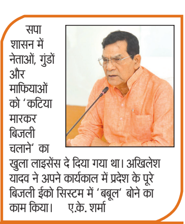
सापा शासन में नेताओं, गुंडों और माफियाओं को 'कटिया मारकर बिजली चलाने' का खुला लाइसेंस दे दिया गया था। अखिलेश यादव ने अपने कार्यकाल में प्रदेश के पूरे बिजली इंचो सिस्टम में 'बबूल' बोनो का काम किया। ए.के. शर्मा