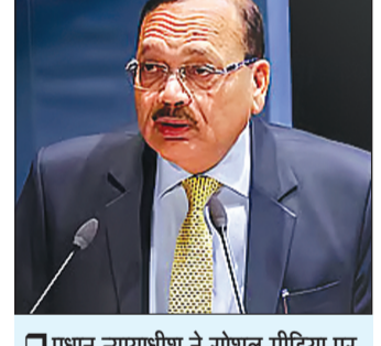
प्रधान न्यायाधीश ने सोशल मीडिया पर उनके हवाले से प्रसारित जातिवादी बयान का खंडन किया

एजेंसी नयी दिल्ली। प्रधान न्यायाधीश सूर्यकांत ने शनिवार को एक अप्रत्याशित घटनाक्रम में अपने नाम से प्रसारित जातिवादी बयान की निंदा करते हुए उसे 'मनगढ़त, घृणित, ओछा और दुर्भावनापूर्ण' बताया। प्रधान न्यायाधीश सूर्यकांत ने अपने बयान में कहा, 'मनगढ़त बयान गढ़ना और उसे देश के सर्वोच्च न्यायिक पद से जोड़ना घोर बेईमानी, जानबूझकर सामाजिक रूप से भड़काने वाला और संवैधानिक मूल्यों के प्रति अवमानना का कृत्य है। बयान के अनुसार, 'इस तरह का गैरजिम्मेदाराना आचरण न्यायपालिका और कानून के शासन में जनता के भरोसे पर सीधा प्रहार करता है। उन्होंने सोशल मीडिया मंच पर व्यापक रूप से प्रसारित हो रहे कुछ पोस्ट का जिक्र किया और उन्होंने विशेष रूप से 'एक्स' पर 'अनरिजर्म्बेडमेंट' नाम के एक अकाउंट का उल्लेख किया। प्रधान न्यायाधीश ने