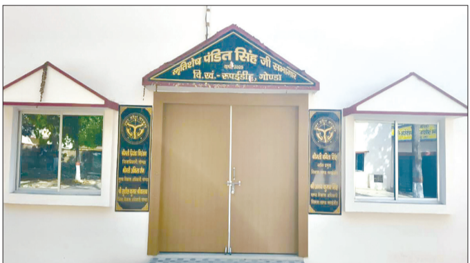
कैनविज टाइम्स संवाददाता

गोंडा । रुपईडीह ब्लॉक परिसर में बना सभागार पर करीब पचास लाख रुपये खर्च होने के बावजूद भी मूलभूत सुविधाओं से वंचित है।हाल ही में इसका कायाकल्प किया गया था,लेकिन स्थिति में खास सुधार नहीं हुआ है।सभागार में बैठक के दौरान कई असुविधाओं का सामना करना पड़ता है,यहां सात एयर कंडीशनर (एसी ) लगाए गए हैं,लेकिन उन के संचालन की कोई व्यवस्था नहीं है।इसके अति रिक्त,सभागार के बगल में बने शौचालय में भी कि सी प्रकार की सुविधा न होने के कारण पुरुषों और महिलाओं को परेशानी होती है।पचास लाख रुपये खर्च होने के बावजूद सभागार का नामकरण भी विवादों में है।इसका नाम 'पंडित सिंह स्मृति शेष' रखा गया है।जबकि ब्लॉक प्रांगण में कई