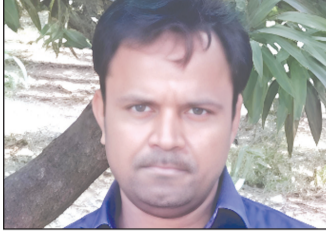
□ हत्या के बाद भाग रहा आरोपी गिरफ्तार, अवैध शराब बिक्री पर भी उठे सवाल