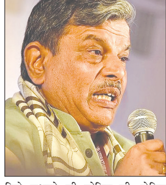
रिश्ते सुधारने की कोशिश की, लेकिन पाकिस्तान की ओर से बार-बार उकसावे वाली घटनाएं सामने आती रहीं। होसबले ने कहा कि अटल बिहारी वाजपेयी लाहौर बस यात्रा पर गए थे और दोनों देशों के बीच शांति बहाली की कोशिश की थी। उन्होंने यह भी याद दिलाया कि प्रधानमंत्री नरेन्द्र मोदी ने अपने शपथ ग्रहण समारोह में

नई दिल्ली। राष्ट्रीय स्वयंसेवक संघ के महासचिव दत्तात्रेय होसबले ने भारत-पाकिस्तान संबंधों को लेकर अहम बयान दिया है। उन्होंने कहा कि भारत को पाकिस्तान के साथ बातचीत की संभावनाएं पूरी तरह खत्म नहीं करनी चाहिए और संवाद का रास्ता हमेशा खुला रखना चाहिए। हालांकि उन्होंने यह भी स्पष्ट किया कि देश की सुरक्षा और स्वाभिमान सर्वोच्च हैं और किसी भी आतंकी गतिविधि का जवाब सख्ती से दिया जाना चाहिए। एजेंसी को दिए एक इंटरव्यू में होसबले ने कहा कि भारत ने हमेशा शांति और बातचीत की पहल की है। उन्होंने पूर्व प्रधानमंत्री अटल बिहारी वाजपेयी और प्रधानमंत्री नरेन्द्र मोदी के प्रयासों का उदाहरण देते हुए कहा कि भारत ने कई बार