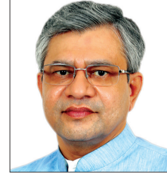
2026-27 के लिए इस वृद्धि को मंजूरी दी। केंद्रीय मंत्री अश्विनी वैष्णव ने यहां यह जानकारी देते हुए कहा कि विपणन सत्र 2026-27 के ● शेष पेज 11 पर

नयी दिल्ली। केंद्र सरकार ने खरीफ फसल वर्ष 2026-27 के विपणन सीजन के लिए फसलों के न्यूनतम समर्थन मूल्य (एमएसपी) में बुधवार को इजाफे का ऐलान किया। पिछले वर्ष की तुलना में एमएसपी में सूरजमुखी में 622 रुपये प्रति क्विंटल, कपास में 557 रुपये प्रति क्विंटल, नाइजरसीड में 515 रुपये प्रति क्विंटल और तिल में 500 रुपये प्रति क्विंटल की वृद्धि की गयी है। प्रधानमंत्री नरेन्द्र मोदी की अध्यक्षता में आर्थिक मामलों की मंत्रिमंडल समिति (सीसीईए) ने विपणन सीजन