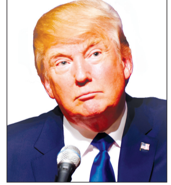
अधिनियम राष्ट्रपति को इतने बड़े स्तर पर टैरिफ लगाने की अनुमति नहीं देता।

वाशिंगटन। अमेरिका की एक अपीलौय अदालत ने राष्ट्रपति डोनाल्ड ट्रंप के नए 10 फीसदी आयात शुल्क को अवैध ठहराने वाले निचली अदालत के फैसले पर फिलहाल रोक लगा दी है। इससे ट्रंप प्रशासन के दौरान लागू गए व्यापक टैरिफ अभी लागू रहेंगे। इससे पहले अमेरिकी अंतरराष्ट्रीय व्यापार अदालत ने कहा था कि ट्रंप ने राष्ट्रपति के अधिकारों का दायरा पार करते हुए कई देशों से आयात पर व्यापक शुल्क लगाए थे। अदालत के मुताबिक अंतरराष्ट्रीय आपात आर्थिक शक्तियों