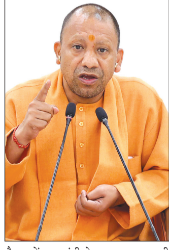
बैठक में मुख्यमंत्री ने शासन-प्रशासन की कार्यप्रणाली को अधिक उत्तरदायी, अनुशासित और संसाधन-संवेदनशील

लखनऊ। मुख्यमंत्री योगी आदित्यनाथ ने प्रदेश मंत्रिमंडल के सदस्यों से सप्ताह में कम से कम एक दिन सार्वजनिक परिवहन का उपयोग करने का आह्वान करते हुए शासन में मितव्ययिता, ऊर्जा संरक्षण और जनप्रेरक आचरण की नई कार्यसंस्कृति विकसित करने का संदेश दिया है। उन्होंने मंत्रियों से अपनी वाहन फ्लीट को 50 प्रतिशत तक कम करने का भी आह्वान किया है। साथ ही मुख्यमंत्री ने अगले छह माह तक प्रदेश सरकार के सभी मंत्रियों एवं वरिष्ठ अधिकारियों को अपरिहार्य परिस्थितियों को छोड़कर विदेश यात्राओं से परहेज करने के निर्देश दिए हैं।