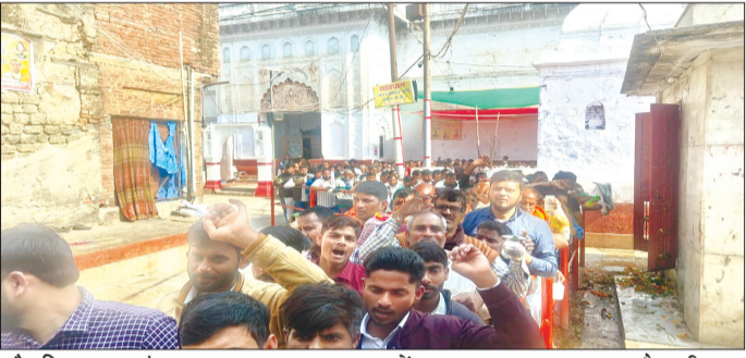
केनविज टाइम्स संवाददाता

रामनगर बाराबंकी। पुरुषोत्तम मास के अंतिम सोमवार को श्रीलोपेश्वर महादेवा धाम में हजारों श्रद्धालुओं ने पहुंचकर लोपेश्वर का जलाभिषेक कर पूजा अर्चना की। मंदिर परिसर दिनभर जयकारों से गुंजा रहा। श्रद्धालु गंगाजल बेलपत्र भांग धतूरा और पुष्प अर्पित कर भगवान शिव का अभिषेक करते रहे। विशेष मुहूर्त पर बाराबंकी सहित लखनऊ कानपुर उन्नाव