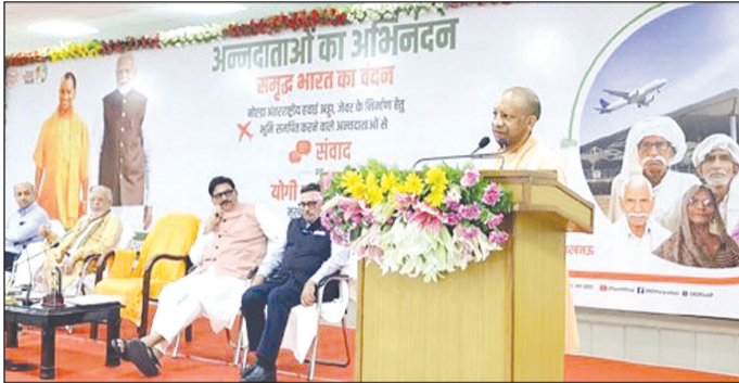
मुख्यमंत्री ने नोएडा इंटरनेशनल एयरपोर्ट, जेवर के निर्माण के लिए भूमि समर्पित करने वाले किसानों से किया संवाद

लखनऊ। मुख्यमंत्री योगी आदित्यनाथ ने कहा कि उत्तर प्रदेश के गौतमबुद्ध नगर जिले में जेवर का इलाका अब वह क्षेत्र बन गया है, जहां 'कुबेर' भी आना चाहते हैं। जेवर एयरपोर्ट भारत का पहला कार्गो व एमआरओ केंद्र बनने जा रहा है। मुख्यमंत्री ने कर्मशियल फ्लाइट प्रारंभ करने के लिए इंडिगो के प्रति भी धन्यवाद ज्ञापित किया। मुख्यमंत्री योगी सोमवार को उत्तर प्रदेश के गौतमबुद्ध नगर जिले में जेवर में नवनिर्मित नोएडा इंटरनेशनल एयरपोर्ट के निर्माण के लिए भूमि देने वाले किसानों से संवाद कर रहे थे। यह किसान जेवर से लखनऊ के लिए संचालित पहली फ्लाइट से आज राजधानी पहुंचे। इन किसानों का मुख्यमंत्री आवास पर स्वागत व सम्मान किया गया। यहां किसानों ने अपने उद्गार व्यक्त किए और मुख्यमंत्री को स्मृति चिह्न भेंट किया और उनके प्रति आभार भी प्रकट किया। इस मौके पर मुख्यमंत्री योगी ने कहा कि गौतमबुद्ध नगर जिले में जेवर का इलाका अब वह क्षेत्र बन गया है, जहां 'कुबेर' भी आना चाहते हैं। योगी ने कहा कि जब हमारी कैबिनेट ने जेवर में एयरपोर्ट निर्माण के लिए प्रस्ताव पारित किया तो मैंने नोएडा के जिलाधिकारी समेत अन्य अधिकारियों से कहा कि 100 दिन के भीतर जमीन अधिग्रहण की कार्रवाई प्रारंभ हो जाए, लेकिन इस अवधि तक कार्रवाई प्रारंभ नहीं हुई। मैंने वहां पहुंचकर समीक्षा बैठक ली तो पता चला कि कोई प्रति नहीं हुई है। मैंने गौतमबुद्ध विश्वविद्यालय, गेट नोएडा में लगभग 100 किसानों के साथ बैठक की। मैंने कहा कि एयरपोर्ट बनना है, लेकिन किसानों ने