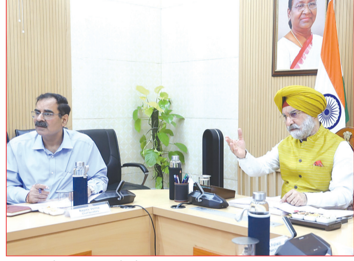
उपराज्यपाल तरनजीत सिंह संधू का अग्निशमन सेवा के कामकाज की समीक्षा के दौरान अधिकारियों के साथ बैठक।

नई दिल्ली। दिल्ली के उपराज्यपाल तरनजीत सिंह संधू ने गुरुवार को दिल्ली अग्निशमन सेवा के कामकाज और ग्रीष्मकालीन कार्य योजना की समीक्षा की। उन्होंने कहा कि आधुनिकीकरण, बुनियादी ढांचे के उन्नयन और कर्मियों की क्षमता बढ़ाने पर विशेष ध्यान दिया गया ताकि दिल्ली की आपातकालीन प्रतिक्रिया प्रणाली को बेहतर बनाया जा सके। उपराज्यपाल ने सोशल मीडिया प्लेटफॉर्म एक्स पर पोस्ट में कहा कि दिल्ली अग्निशमन सेवा नियम, 2010 में प्रस्तावित संशोधनों की जांच करते समय, निवासियों, व्यापारियों और कारोबारियों के साथ व्यापक परामर्श की आवश्यकता पर जोर दिया गया ताकि यह सुनिश्चित किया जा सके कि ढांचा समावेशी, व्यावहारिक और प्रभावी हो। विशेषकर सूर्योदय और सूर्यास्त के समय जब