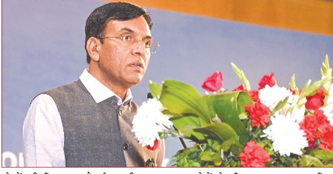
केंद्रीय युवा कार्यक्रम एवं खेल मंत्री डॉ. मनसुख मांडविया का उद्घाटन कार्यक्रम।

नई दिल्ली। केंद्रीय युवा कार्यक्रम एवं खेल मंत्री डॉ. मनसुख मांडविया ने डोपिंग के खिलाफ कड़ा रुख अपनाते हुए कहा है कि सरकार प्रतिबंधित पदार्थों की तस्करी और उनके उपयोग को बढ़ावा देने वालों के खिलाफ आपराधिक प्रावधान लाने की दिशा में काम कर रही है। वे विश्व डोपिंग रोधी एजेंसी (वाडा) के लोबल एंटी-डोपिंग इंटेलेजेंस एंड इन्वेस्टिगेशन नेटवर्क (नैन) के अंतिम सम्मेलन के उद्घाटन सत्र को संबोधित कर रहे थे। डॉ. मांडविया ने कहा कि आज डोपिंग केवल व्यक्तिगत गलती नहीं रह गई है, बल्कि यह एक संगठित बहुराष्ट्रीय नेटवर्क का रूप ले चुकी है। ऐसे में इसे रोकने के लिए वैश्विक स्तर पर समन्वित प्रयास आवश्यक हैं। उन्होंने कहा कि भारत न केवल खेलों में उत्कृष्टता के लिए प्रतिबद्ध है, बल्कि