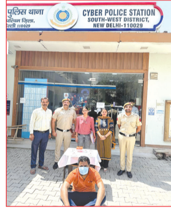
साइबर थाना पुलिस द्वारा एक फर्जी प्रोफाइल बनाकर महिलाओं को ठगने वाले आरोपित को गिरफ्तार किया गया।

नई दिल्ली। दक्षिण-पश्चिम जिले की साइबर थाना पुलिस ने ऑनलाइन डेटिंग और मैट्रिमोनियल ऐप्स के जरिए महिलाओं को निशाना बनाकर करोड़ों की में पंचांग गणना के अनुसार तृतीय केदार भगवान तुंगनाथ के कपाट खुलने की तिथि जैव विविधता घोषित कर दी गई है। 20 अप्रैल बाबा तुंगनाथ की चल विग्रह उत्सव डोली मक्कूमट से रवाना होकर रात्रि प्रवास के लिए भूतनाथ मंदिर पहुंचेगी। 21 अप्रैल डोली भूतनाथ मंदिर से प्रस्थान कर अंतिम रात्रि प्रवास के लिए चोपता पहुंचेगी। 22 अप्रैल को प्रातःकाल वैदिक मंत्रोच्चार और ऋचाओं के बीच तुंगनाथ धाम के कपाट ग्रीष्मकाल के लिए खोल दिए जाएंगे।