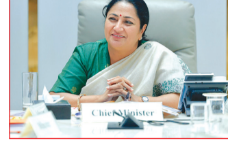
मुख्यमंत्री रेखा गुप्ता का उद्घाटन कार्यक्रम।

उच्च गुणवत्ता वेल्डिंग), गैस कटिंग, प्लाज्मा कटिंग, वेल्डिंग सिमुलेटर और मेटल फैब्रिकेशन वर्कस्टेशन जैसी सुविधाएं उपलब्ध होंगी। यह पहल न केवल स्किल डेवलपमेंट को मजबूत करेगी, बल्कि प्रशिक्षण को वर्तमान मैनुफैक्चरिंग और फैब्रिकेशन उद्योग मानकों के अनुरूप बनाते हुए इस सुविधा को एक उन्नत वेल्डिंग प्रशिक्षण केंद्र में परिवर्तित करेगी। उन्होंने कहा कि इस लैब से वेल्डर, फिटर, टर्नर (धातु को मशीन द्वारा आकार देने वाला विशेषज्ञ), मैकेनिक मोटर वाहन और शीट मेटल वर्कर (शीट धातु कार्य विशेषज्ञ) ट्रेड के प्रशिक्षुओं को लाभ मिलेगा। इन ट्रेड्स में कुल 200 स्टूडेंट्स को ट्रेनिंग दी जा सकेगी। मुख्यमंत्री ने बताया कि आईटीआई अरब की सराय (निजामुद्दीन) में ऑटोमोटिव सेक्टर की लैब्स को आधुनिक तकनीकों के साथ अपग्रेड किया जाएगा। यहां