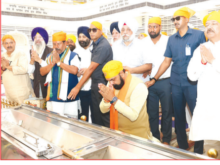
मुख्यमंत्री रेखा गुप्ता का तख्त श्रीहरिमंदिर जी परिसर, पटना साहिब में मत्था टेकने का दृश्य।

पटना। मुख्यमंत्री सम्राट चौधरी आज दशमेश पिता श्री गुरु गोविंद सिंह जी महाराज की जन्मस्थली तख्त श्रीहरिमंदिर जी परिसर, पटना साहिब पहुंचे। मुख्यमंत्री ने तख्त श्रीहरिमंदिर जी, पटना साहिब में मत्था टेका और राज्य के सुख, शांति एवं समृद्धि की कामना की। इस दौरान श्री हरिमंदिर जी प्रबंधक कमिटी के सदस्यों द्वारा मुख्यमंत्री को तलवार, अंगवस्त्र, सरोपा एवं प्रतीक चिन्ह भेंटकर उनका स्वागत किया गया। मुख्यमंत्री ने पत्रकारों से बातचीत करते हुये कहा कि गुरु की प्रेरणा से देश आगे बढ़ रहा है। प्रधानमंत्री नरेन्द्र मोदी के नेतृत्व में देश विकास के पथ पर अग्रसर है। नीतीश कुमार ने बिहार का लंबे समय तक नेतृत्व करते हुये राज्य को आगे