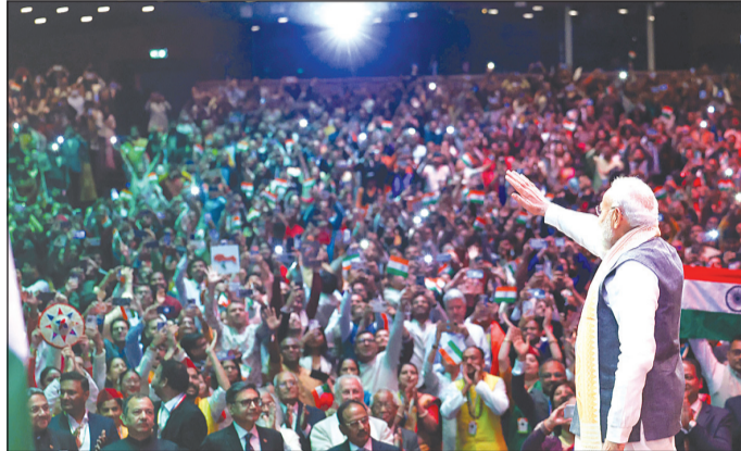
नीदरलैंड में भारतीय समुदाय को प्रधानमंत्री ने संबोधित किया

द हेग। प्रधानमंत्री नरेंद्र मोदी ने शनिवार को कहा कि दुनिया अभूतपूर्व चुनौतियों की एक श्रृंखला का सामना कर रही है। पहले कोरोना महामारी आई, फिर युद्ध शुरू हो गए और अब ऊर्जा संकट है। अपने पांच देशों के दौर के हिस्से के तौर पर द हेग में भारतीय प्रवासियों को संबोधित करते हुए पीएम ने कहा कि आज, मानवता के सामने कई बड़ी चुनौतियां भी हैं। यह दशक दुनिया के लिए आपदाओं का दशक बनता जा रहा है। प्रधानमंत्री ने आगाह किया कि इन चुनौतियों से तेजी से न निपटने पर वैश्विक विकास की उपलब्धियां खत्म हो सकती हैं और आबादी का एक बड़ा हिस्सा गरीबी में जा सकता है। मोदी ने कहा, अगर इन स्थितियों को तेजी से नहीं बदला गया, तो पिछले कई दशकों की उपलब्धियां खत्म हो जाएंगी और दुनिया की आबादी का एक बहुत बड़ा हिस्सा गरीबी के दलदल में फंस जाएगा। पीएम मोदी ने कहा कि भारत और नीदरलैंड मिलकर एक भरोसेमंद, पारदर्शी और भविष्य के लिए तैयार सपनाई चैन बनाने पर काम कर रहे हैं, ताकि वैश्विक रूढ़िवादी से निपटा जा सके। मोदी ने कहा, ऐसे समय में दुनिया एक लचीली सपनाई चैन के बारे में बात कर रही है। इसके लिए, भारत और नीदरलैंड भविष्य के लिए तैयार सपनाई चैन स्थापित करने की कोशिश कर रहे हैं। मोदी ने कहा कि 21वीं