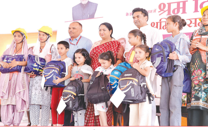
हजार निर्माण श्रमिकों को सुरक्षा किट और श्रमिक परिवारों के 100 बच्चों को शिक्षा किट प्रदान की। उन्होंने मजदूरों से बातचीत कर उनकी समस्याओं को जाना और उनके

नई दिल्ली। दिल्ली की मुख्यमंत्री रेखा गुप्ता ने शुक्रवार को अंतरराष्ट्रीय श्रमिक दिवस के अवसर पर प्रतिवर्ष 35 हजार श्रमिकों को प्रशिक्षित करने वाले कौशल विकास अभियान का शुभारंभ किया। मुख्यमंत्री धीरपुर स्थित संत निरंकारी अस्पताल की निर्माण साइट पर श्रम विभाग और दिल्ली भवन एवं सन्निर्माण श्रमिक कल्याण बोर्ड की ओर से आयोजित श्रमिक सम्मान समारोह में शामिल हुईं। उन्होंने श्रमिकों के लिए जल्द ही आधुनिक लेबर चौक और श्रमिक सेवा केंद्र स्थापित करने की घोषणा करते हुए कहा कि इनके माध्यम से आवश्यक सेवाएँ सीधे श्रमिकों तक पहुँचेंगी। मुख्यमंत्री ने इस दौरान एक