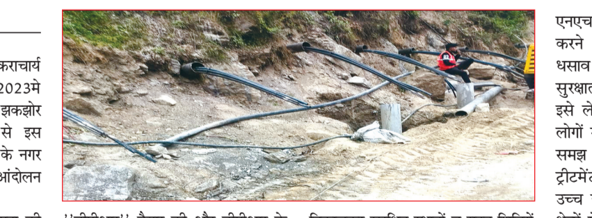
'डीपीआर' तैयार की और डीपीआर के अनुरूप केन्द्र सरकार ने डेढ़ हजार करोड़ से अधिक की धनराशि स्वीकृत की और तीन वर्ष बाद मार्च 2026 में कार्यदायी संस्थाओं ने कार्य भी शुरू कर दिया जिसे लेकर स्थिति स्पष्ट नहीं है और तरह तरह की आशंकाएँ पैदा हो गई हैं। भू धसाव आपदा के दौरान मनोहर बाग वार्ड, सिंहधर वार्ड, गांधीनगर वार्ड तथा सुनील, रविग्राम व नृसिंह मंदिर वार्ड के कुछ हिस्से प्रभावित हुए जहाँ से लोगों को घरों से

ज्योतिमठ। आद्य जगदगुरु शंकराचार्य की तपस्थली ज्योतिमठ को वर्ष 2023में भू-धसाव की अनेखी आपदा ने झकझोर कर रख दिया था, भू-धसाव से इस ऐतिहासिक एवं पौराणिक संस्कृति के नगर के अस्तित्व को बचाने के लिए आंदोलन का सहारा भी लेना पड़ा।