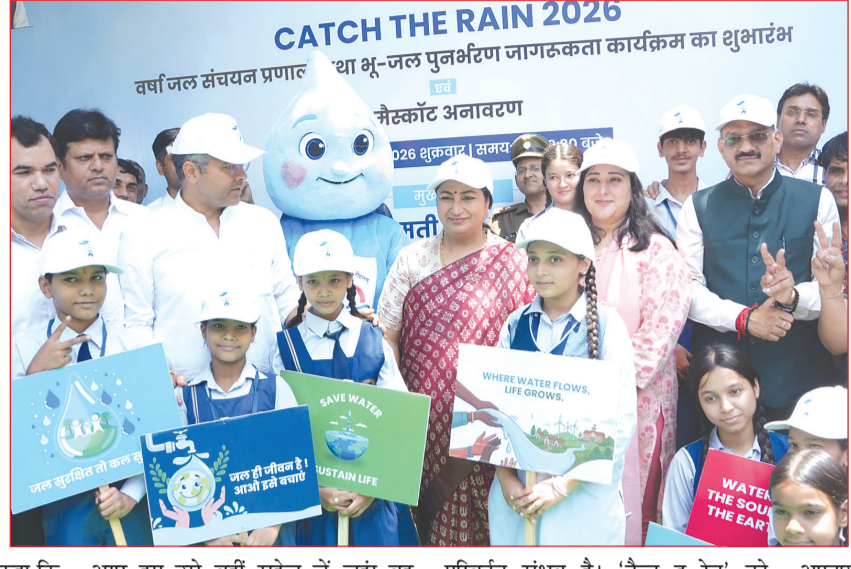
अगर हम उसे वहीं सहेज लें जहाँ वह गिरती है, तो दिल्ली की जल स्थिति में बड़ा परिवर्तन संभव है। 'कैच द रेन' को अभियान नहीं बल्कि जन स्वभाव बनाएं।