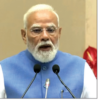
देश की पहली वाणिज्यिक स्तर की कोयले-से-अमोनियम नाइट्रेट उत्पादन परियोजना

नई दिल्ली। प्रधानमंत्री नरेन्द्र मोदी ने शुक्रवार को कहा कि जब सरकार, युवा और उद्योग एक साथ आगे बढ़ते हैं तो रोजगार सृजन की गति कई गुना बढ़ जाती है। उन्होंने कहा कि प्रधानमंत्री विकसित भारत रोजगार योजना (पीएम-वीबीआरवाई) इसी नए भारत की पहचान है, जिसने अब तक करीब 70 लाख रोजगार सृजित किए हैं और पहली बार नौकरी पाने वाले लाखों युवाओं को सामाजिक सुरक्षा का कवच प्रदान किया है। प्रधानमंत्री विकसित भारत रोजगार योजना के तहत करीब 2,400 करोड़ रुपये की प्रोत्साहन राशि वितरित करने के बाद अपने संबोधन में मोदी ने कहा कि दुनिया आज भारत की युवा शक्ति, प्रतिभा, कौशल और क्षमता को पहचान रही है। हाल ही में जी-7 शिखर सम्मेलन के दौरान विकसित देशों के नेताओं के साथ हुई बातचीत का