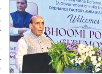
नागपुर में 10 हजार टन क्षमता वाली एल्युमिनियम एक्सट्रूजन प्रेस का उद्घाटन