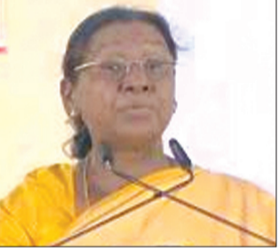
राष्ट्रपति ने मग्न में सिकल सेल एनीमिया उन्मूलन में हुई सामुदायिक भागीदारी को सराहा

खंडवा। राष्ट्रपति द्रौपदी मुर्मू ने सिकल सेल एनीमिया के प्रति जागरूकता, समय पर जांच और इलाज को बढ़ावा देने पर जोर देते हुए कहा कि मध्य प्रदेश में सवा करोड़ लोगों के स्क्रीनिंग का लक्ष्य समय से पहले पूरा हुआ है। राष्ट्रीय सिकल सेल एनीमिया उन्मूलन मिशन अंतर्गत मध्य प्रदेश ने जो बहुआयामी उपलब्धियां हासिल की हैं। इसके लिए मैं राज्य सरकार का सराहना करती हूँ। राष्ट्रपति मुर्मू शुक्रवार को मध्य प्रदेश के खण्डवा जिले के ऑकरेश्वर में विश्व सिकल सेल दिवस पर आयोजित राज्य स्तरीय कार्यक्रम को संबोधित कर रही थीं। उन्होंने कहा कि अंतरराष्ट्रीय सिकल सेल दिवस पर इस विशेष कार्यक्रम का आयोजन स्वास्थ्य क्षेत्र में एक महत्वपूर्ण चुनौती का सामना करने की दिशा में एक सार्थक प्रयास है। इस आयोजन से जुड़े सभी लोगों का कार्य सराहनीय है। उन्होंने कहा कि यह संतोष की बात है कि वर्ष 2023 में राष्ट्रीय मिशन का शुभारंभ ● शेष पेज 11 पर