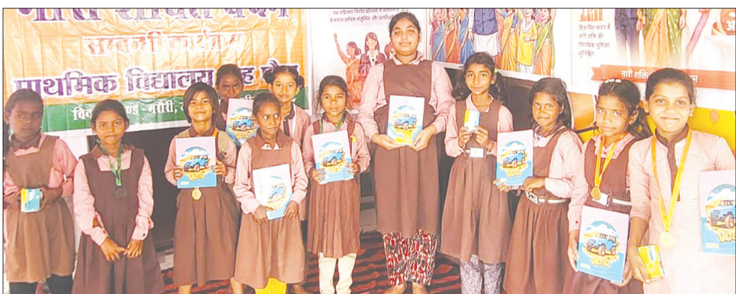
केनविज टाइम्स संवाददाता

पीलीभीत प्राथमिक विद्यालय टाह पीटा में आज नारी शक्ति वंदन के अंतर्गत विभिन्न कार्यक्रमों का आयोजन किया गया। विद्यालय में नारी शक्ति वंदन अधिनियम के संबंध में एक जागरूकता गोष्ठी आयोजित की गई जिसका शुभारंभ