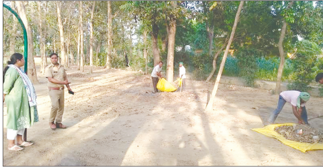
केनविज टाइम्स संवाददाता