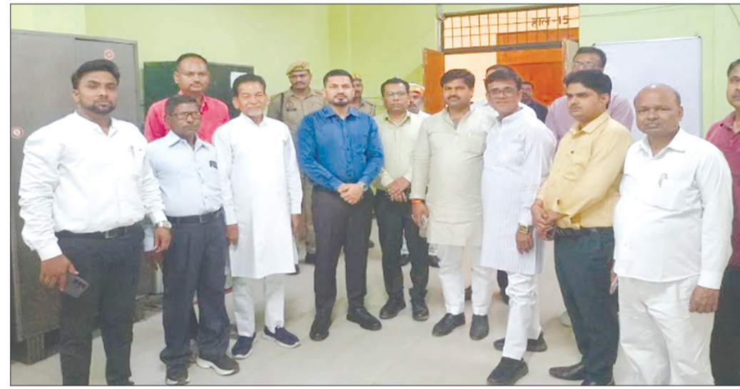
केनविज टाइम्स संवाददाता