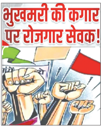
कैनविज टाइम्स संवाददाता

गोंडा । जिले में विभिन्न पंचायतों में तैनात ग्राम रोजगार सेवक दस माह से अपने वेतन के लिए तरस रहे हैं, लेकिन उन्हें केंद्र से पैसा न आने की बात कहकर हर बार टाला जा रहा है, ऐसे में वेतन न मिलने के चलते ग्राम