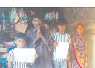
कैनविज टाइम्स संवाददाता

पुलिस पर मारपीट व लापरवाही का आरोप, चार दिन बाद भी नहीं दर्ज हुई एफआईआर