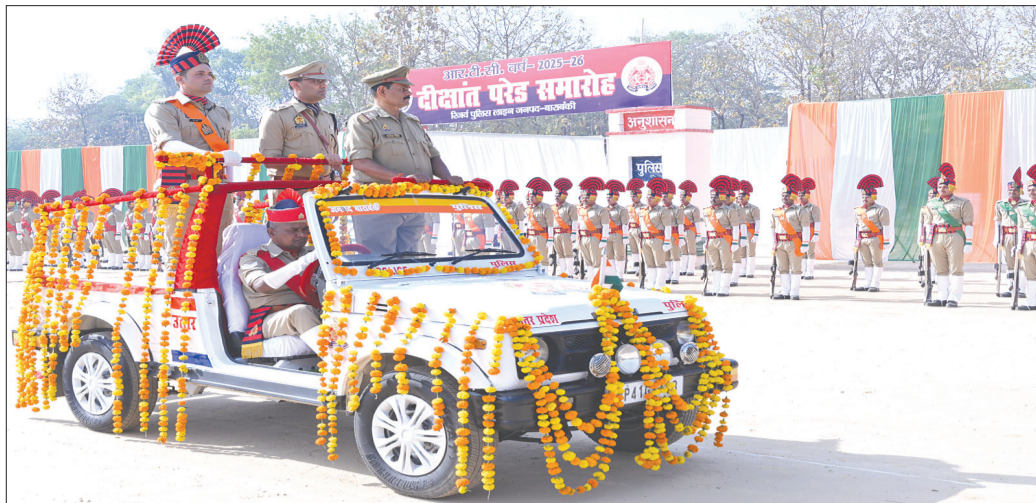
कैनविज टाइम्स संवाददाता

रच रही हैं। बेटियों की यह सफलता न केवल परिवार, बल्कि समाज और जनपद के लिए भी गर्व का विषय है। आज इन प्रतिभावान बेटियों ने यह संदेश दिया है कि मेहनत, समर्पण और आत्मविश्वास से