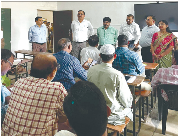
कैनविज टाइम्स संवाददाता

सिरौलीगोसपुर बाराबंकी। तहसील के राजकीय इंटर कॉलेज में तीन दिवसीय जनगणना प्रशिक्षण संपन्न हुआ। इसमें प्रगणकों को मकान सूचीकरण, एचएलबी