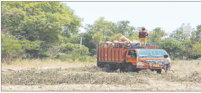
केनविज टाइम्स संवाददाता