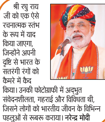
श्री रघु राय जी को एक ऐसे रचनात्मक स्तंभ के रूप में याद किया जाएगा, जिन्होंने अपनी दृष्टि से भारत के सतरंगी रंगों को कैमरे में कैद किया। उनकी फोटोग्राफी में अद्भुत संवेदनशीलता, गहराई और विविधता थी, जिसने लोगों को भारतीय जीवन के विभिन्न पहलुओं से रूबरू कराया। नरेन्द्र मोदी