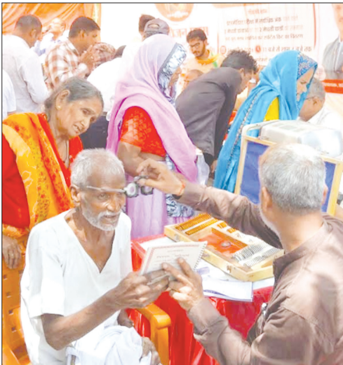
तत्काल राहत प्रदान की गई, जबकि शेष सेवाओं के क्षेत्र में भी महत्वपूर्ण पहल की गई। शिविर में 53 बुजुर्गों की आंखों को

कार्यक्रम के दौरान स्थानीय नागरिकों से जुड़ी विभिन्न समस्याओं के कुल 18 आवेदन प्राप्त हुए, जिनमें सड़क और नाली निर्माण, पुलिस सहायता, पार्क सौंदर्यीकरण, दिव्यांग प्रमाण पत्र, आर्थिक सहायता, हैंडपंप, नगर निगम, आयुष्मान कार्ड, स्ट्रीट लाइट और सफाई जैसी समस्याएँ शामिल रही। इनमें से 4 मामलों का मौके पर ही निस्तारण कर लोगों को