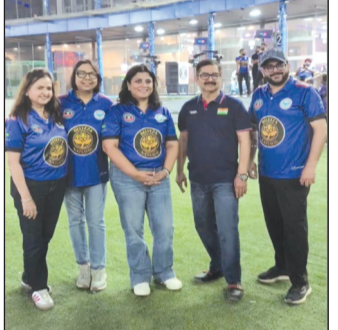
कैनविज टाइम्स संवाददाता

लखनऊ। इन्फिनिटी कॉर्पोरेट क्रिकेट लीग का आयोजन उत्साह, खेल भावना और शानदार सहभागिता के साथ सफलतापूर्वक संपन्न हुआ। इस प्रतियोगिता में सदस्यों, उनके परिवारों और कॉर्पोरेट जगत के लोगों ने बढ़-चढ़कर भाग लिया। रोमांच से भरपूर फाइनल मुकाबले में एल्डेको इलेवन ने एनीटाइम फिटनेस को हराकर खिताब अपने नाम किया। टीम ने