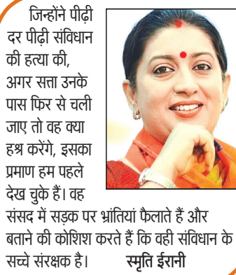
जिन्होंने पीढ़ी दर पीढ़ी संविधान की हत्या की, अगर सत्ता उनके पास फिर से चली जाए तो वह क्या हथ्र करेगा, इसका प्रमाण हम पहले देख चुके हैं। वह संसद में सड़क पर प्रतियोगिता फेलाते हैं और बताने की कोशिश करते हैं कि वही संविधान के सच्चे संरक्षक हैं। स्मृति ईरानी