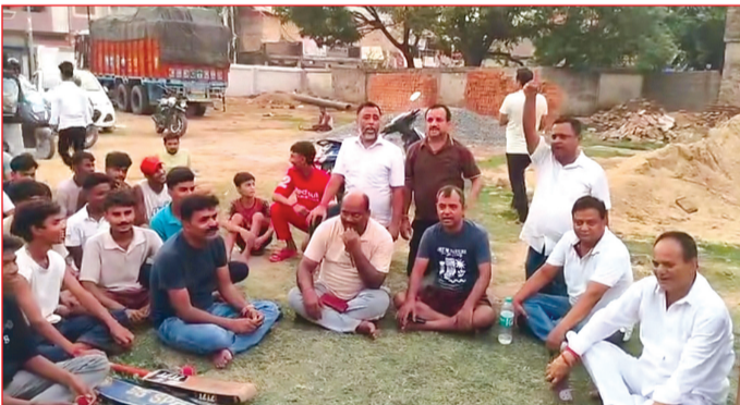
भारी संख्या में स्थानीय लोगों और बच्चों ने मैदान परिसर में एकत्रित होकर इस निर्माण कार्य के खिलाफ अपना शांतिपूर्ण विरोध दर्ज कराया। विरोध प्रदर्शन में शामिल लोगों का स्पष्ट रूप से मानना है कि इस पूरे क्षेत्र में बच्चों के खेलने, दौड़ने और अन्य शारीरिक व खेल गतिविधियों के लिए यह एकमात्र खुला मैदान बचा है। आज के डिजिटल दौर में, जहाँ बच्चे मैदानों से दूर हो रहे हैं, ऐसे में इस एकमात्र खेल मैदान को पार्क के रूप में तब्दील कर इसके दायरे को सीमित करना बच्चों के हितों के साथ सरसर नाईसाफी होगी। पार्क बनने से कंक्रीट का ढांचा बढ़ेगा और बच्चों के दौड़ने-खेलने की खुली जगह खत्म हो जाएगी। प्रदर्शनकारियों ने साफ किया कि वे

भागलपुर। भागलपुर के टीएनबी कॉलेजिएट के मैदान पर अमृत 2.0 योजना के तहत पार्क के निर्माण का विरोध होना शुरू हो गया है। स्थानीय लोग इसका विरोध प्रदर्शन और सोशल मीडिया के माध्यम से कर रहे हैं। टीएनबी कॉलेजिएट मैदान सिर्फ एक खाली जमीन का टुकड़ा नहीं, बल्कि इस क्षेत्र के सैकड़ों बच्चों के सपनों, उनकी खेल प्रतिभा और एक स्वस्थ भविष्य का मजबूत आधार है। आज इसी मैदान को बचाने और बच्चों के खेल के अधिकार को सुरक्षित रखने के लिए स्थानीय लोगों और बच्चों ने एक सुर में आवाज बुलंद की है। वार्ड संख्या 19 के अंतर्गत 'अमृत 2.0 योजना' के तहत इस ऐतिहासिक मैदान परिसर में एक पार्क निर्माण का प्रस्ताव है, जिसका स्थानीय स्तर पर विरोध शुरू हो गया है।