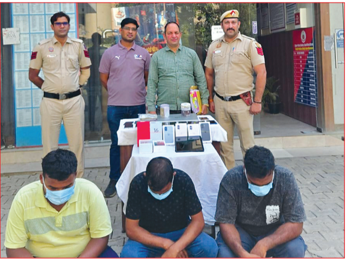
फाइल भेजी। महिला द्वारा फाइल इंस्टॉल करते ही साइबर अपराधियों ने उसके मोबाइल का एक्सेस हासिल कर बैंक खाते और क्रेडिट कार्ड से करीब 2.64 लाख रुपये की धोखाधड़ी कर ली। जांच में सामने आया कि ठगी की रकम को तुरंत मदद के लिए दिए गए नंबर पर संपर्क करने पर ठगों ने क्वार्टर पर जर्जर एक एपीके