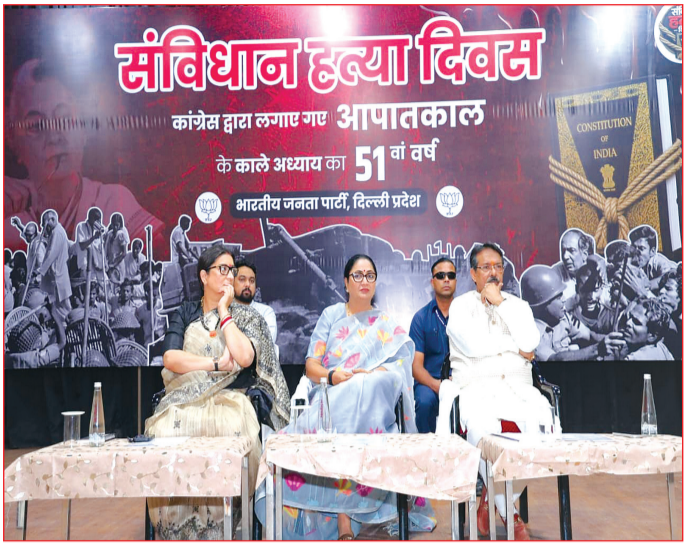
पर आपातकाल में बंदी रहे कार्यकर्ताओं का दिल्ली की मुख्यमंत्री रेखा गुप्ता, पूर्व

भारतीय जनता पार्टी (भाजपा) की दिल्ली प्रदेश इकाई ने शुक्रवार 51वीं वर्षगांठ पर शुक्रवार को नई दिल्ली नगरपालिका परिषद (एनडीएससी) कन्वेंशन सेंटर में हस्तसंविधान हत्या दिवस सत्र के अवसर पर 'आपातकाल काला दिवस सेमीनार' का आयोजन किया। इस अवसर