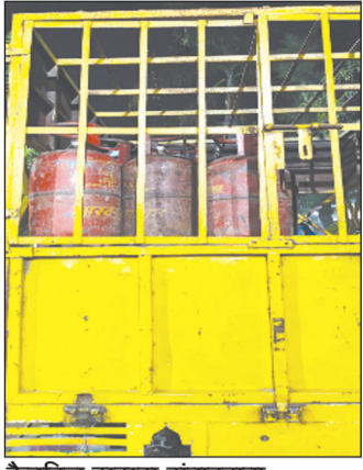
कैनविज टाइम्स संवाददाता

गोंडा । एलपीजी सिलेंडर के लिए मारामारी कम न ही हो रही है। तत्कालीन बीस दिन बाद भी एजेंसियों और सिलेंडर गोदामों पर उपभोक्ताओं की लंबी लाइनें नजर आ रही हैं। इसका सबसे बड़ा असर टैले-खोमचे के साथ छोटे होटल के कारोबारों पर पड़ा है। टैले खोमचे वाले को सिलेंडर न मिलने से लकड़ी या कोयले की भट्टी व इंडक्शन चूल्हा ज लाने पर मजबूर हैं। हालांकि जिला मुख्यालय पर काम करने आने वाले अधिकांश श्रमिक आसपास से आते हैं इसलिए उनके ऊपर गैस सिलेंडर संकट का ख़ास प्रभाव नहीं पड़ रहा है। जिल में कैनविज ने कई गैस एजेंसियों पर पड़ताल की।