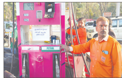
दिए गए हैं।

गोंडा । एलपीजी के साथ क्या अब जिले में सच में पेट्रोल और डीजल की किल्लत होने वाली है...? क्या देश के कई पेट्रोल पंप सूख गए हैं। गोंडा में कई पेट्रोल पंपों पर पेट्रोल नहीं है का बोर्ड लगा हुआ है। यानी इन पंपों पर पेट्रोल और डीजल नहीं मिल रहा है। हालांकि सरकार व जिला प्रशासन कई बार यह आश्वासन दे चुका है कि देश में पेट्रोल और डीजल की कोई कमी नहीं है। इसके बावजूद काफी लोग दो दिन से पेट्रोल पम्पों पर गाड़ी का टैंक फुल करवाने के लिए पेट्रोल पंप की लाइन में नजर आ रहे हैं। दरअसल, ईरान युद्ध के कारण देश में एलपीजी और तेल की कुछ परेशानी देखी गई है। केंद्र सरकार के तयाम आश्वासनों के बाद भी जिले के कई हिस्सों में पैनिक बाइंग (घबराहट में खरीदारी) का माहौल बना हुआ है। तेल की कमी और कीमतों में बढ़ोतरी की अफवाहों के चलते गोंडा के ग्रामीण क्षेत्रों व शहरी क्षेत्र में पेट्रोल पंपों के बाहर लंबी कतारें देखी जा रही हैं। हालात इतने खराब हो गए हैं कि कई पेट्रोल पंपों पर नो पेट्रोल के बोर्ड लगा