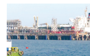
युद्धविराम वार्ता के बीच ईरान में मिसाइल साइट को भी निशाना बनाया