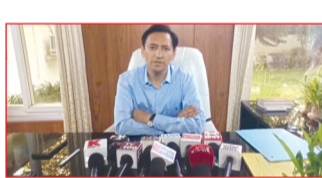
गणना के दौरान उनके भवन पर कुछ जगह मार्किंग भी गणना कार्मिक कर सकते हैं जिसमें कोई नंबर भी डाल सकते हैं तो उसमें कोई ऐसी स्थिति ना हो कि आप उसका विरोध करें और इसमें आपको भी पूरा-पूरा सहयोग करना आवश्यक है। कुमाऊं आयुक्त ने जनता से अपील करते हुए कहा कि उन्हें जनगणना के संबंध में किसी भी प्रकार की जानकारी आदि लेनी हो तो,वह टॉल फ्री नंबर1855 जो प्रातः 9:00 बजे से सायं 6:00 बजे तक कार्य करेगा, इसका पूरा लाभ लेते हुए, इस महत्वपूर्ण राष्ट्रीय कार्य में अपना सहयोग प्रदान करें।

हल्द्वानी। कुमाऊं कमिश्नर व सचिव मुख्यमंत्री वीपक रावत ने अत्यांत करायी भारत की जनगणना 2027 के अंतर्गत मकान सूचीकरण एवं मकान की गणना का कार्य प्रारंभ हो गया है, इसके अंतर्गत घर-घर जाकर संगणक व गणना टीम द्वारा भवन गणना का कार्य प्रारंभ कर दिया गया है। उन्होंने कहा गणना कार्मिक उनके घरों की आएंगे, उनके पास अपना सरकारी पहचान पत्र भी होगा। जिसे आप सत्यापित भी कर सकते हैं। उनके द्वारा घर घर जाकर आपसे (प्रत्येक घर से)कुछ जानकारी और कुछ सूचनाएं ली जाएगी, उनके द्वारा ली जा रही सूचना को सभी लोग गणना टीम को अवश्य ही उपलब्ध कराएं। आयुक्त ने नागरिकों को अत्यांत कराते हुए कहा कि