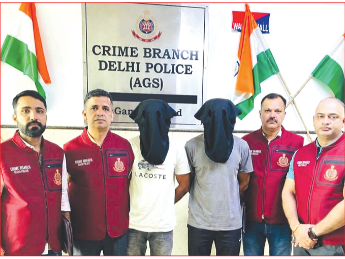
ब्रामद हुई। इसके बाद 25 सितंबर 2025 को क्राइम ब्रांच थाने में एकआईआर संख्या 268/2025 के तहत एनडीपीएस एक्ट की धाराओं 22/23/29 में मामला दर्ज किया गया। जांच के दौरान तकनीकी साक्ष्य, बैंक लेनदेन, क्रूरियर दस्तावेज, व्हाट्सएप चैट और सल्लाई चैन के आधार पर पांच आरोपितों की पहचान कर उन्हें गिरफ्तार