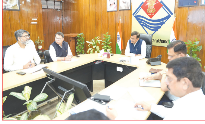
द्वारा उपचारित जल को गैर पेयजल कार्यों में उपयोग किए जाने के निर्देश दिए हैं। उन्होंने कहा कि प्रदेश में जहाँ भी सव्ीज ट्रीटमेंट प्लांट लगाए गए हैं, उनसे उपचारित जल को आसपास के क्षेत्रों में गैर पेयजल कार्यों में 100 प्रतिशत उपयोग में लाए जाने हेतु कार्ययोजना तैयार की जाए। उन्होंने प्रदेश के भीतर सभी कंप्रेस्ड बायोगैस प्लांट्स और वेस्ट टू एनर्जी

देहरादून। मुख्य सचिव आनन्द बर्द्धन ने सोमवार को सचिवालय में स्वच्छ भारत मिशन (शहरी) 2.0 की समीक्षा की। बैठक के दौरान विभिन्न मुद्दों पर चर्चा की गई। मुख्य सचिव ने प्रदेश में टोस अपशिष्ट प्रबंधन के लिए कम्पलीट मैकेनिज्म तैयार किए जाने के निर्देश दिए हैं। इसके लिए शीघ्र कार्ययोजना प्रस्तुत किए जाने के निर्देश दिए। इसके साथ ही, उन्होंने स्वच्छ भारत मिशन के तहत अधिकारियों को चारधाम यात्रा मार्गों एवं जनपदों के प्रवेश मार्गों पर टोस अपशिष्ट के निस्तारण के लिए अतिरिक्त फंड्स उपलब्ध कराये जाने के निर्देश दिए हैं। उन्होंने चारधाम यात्रा मार्गों व चारों धामों के आसपास स्वच्छता बनाए रखने के लिए जिलाधिकारियों को निर्देश दिए हैं। उन्होंने इस अतिरिक्त फण्ड का उचित उपयोग किए जाने की बात कही। मुख्य सचिव ने पूरे प्रदेश सव्ीज ट्रीटमेंट प्लांट