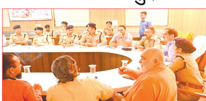
तैयार किए गए प्लान पर विस्तृत चर्चा की गई। आईजी योगेन्द्र सिंह रावत और एसएसपी नवनीत सिंह ने उपसमिति के सदस्यों से यातायात प्लान को और बेहतर बनाने के लिए सुझाव मांगे। अधिकारियों ने यह भी कहा कि प्राप्त उपयोगी सुझावों और सुधार के बिंदुओं के आधार पर कार्ययोजना में आवश्यक बदलाव किए जाएंगे, ताकि मेले के दौरान किसी प्रकार की असुविधा न हो। बैठक के दौरान एसपी ट्रेफिक/क्राइम

हरिद्वार। कुंभ मेला 2027 की तैयारियों के तहत यातायात व्यवस्था को लेकर व्यापक मंथन किया गया। इस दौरान प्रशासन ने विभिन्न हितधारकों से सुझाव आमंत्रित करते हुए व्यवस्था को और अधिक प्रभावी बनाने पर जोर दिया। कुंभ मेला 2027 की तैयारियों को लेकर सोमवार को सीसीआर स्थित मेला भवन के कॉन्फ्रेंस हॉल में एक गोष्ठी आयोजित की गई। बैठक की अध्यक्षता आईजी कुंभ मेला योगेन्द्र सिंह रावत ने की, जिसमें कुंभ मेला यातायात नियंत्रण उपसमिति के अध्यक्ष एसएसपी नवनीत सिंह सहित अन्य सदस्य शामिल हुए। बैठक में साधु-संत, होटल एसोसिएशन, टैक्सी चालक संघ और अन्य संबंधित हितधारकों ने भी भाग लिया। इस दौरान कुंभ मेले के दौरान यातायात व्यवस्था को सुचारू बनाए रखने के लिए