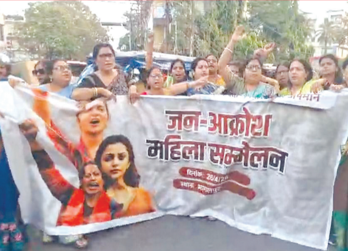
और राहुल गांधी के बयानों को लेकर नाराजगी जताई गई। महिला कार्यकर्ताओं ने कहा कि इस तरह की बयानबाजी किसी भी काम कर रहा है। खास तौर पर पप्पू यादव

भागलपुर। नारी शक्ति वंदन अधिनियम संशोधन को लेकर सियासत तेज हो गई है। इस मुद्दे पर विपक्ष के बयानों के विरोध में सोमवार को भारतीय जनता पार्टी और एनडीए से जुड़ी महिला कार्यकर्ताओं ने भागलपुर में आक्रोश रैली निकालकर जोरदार प्रदर्शन किया। रैली में बड़ी संख्या में महिलाओं की भागीदारी देखी गई, जिन्होंने सड़कों पर उतरकर अपने अधिकारों और सम्मान की रक्षा के लिए आवाज बुलंद किया। प्रदर्शनकारी महिलाओं का आरोप है कि नारी शक्ति से जुड़े इस महत्वपूर्ण अधिनियम पर विपक्ष गलत तरीके से अपनी बात रख रहा है और महिलाओं की गरिमा को ठेस पहुंचाने का काम कर रहा है। खास तौर पर पप्पू यादव