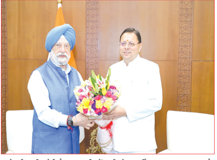
उल्लेखनीय वृद्धि होती है। इस अवधि में राज्य को करीब 9,67,949 व्यावसायिक सिलेंडरों की आवश्यकता होती है। ऐसे में

नई दिल्ली। उत्तराखंड के मुख्यमंत्री पुष्कर सिंह धामी ने चारधाम यात्रा के सुचारू संचालन को लेकर व्यावसायिक एलपीजी सिलेंडरों की आपूर्ति 100 प्रतिशत बनाए रखने का अनुरोध किया है। इस संबंध में उन्होंने सोमवार नई दिल्ली स्थित कर्तव्य भवन में केंद्रीय पेट्रोलियम एवं प्राकृतिक गैस मंत्री हरदीप सिंह पुरी से भेंट कर विस्तृत चर्चा की। मुख्यमंत्री ने बताया कि अप्रैल से नवंबर तक चलने वाली चारधाम यात्रा के दौरान देश-विदेश से लाखों श्रद्धालु उत्तराखंड पहुंचते हैं, जिससे व्यावसायिक एलपीजी की मांग में