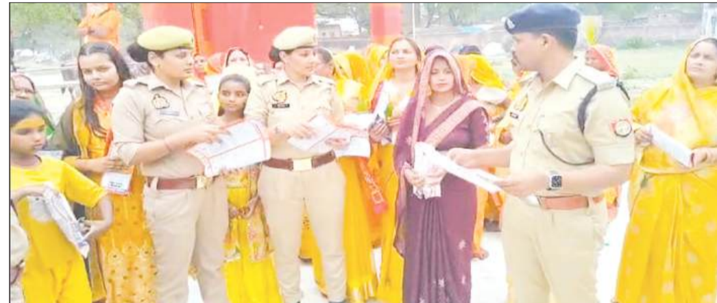
कैनविज टाइम्स संवाददाता

कुड़वार/सुल्तानपुर। महिलाओं को सकार द्वारा चलाई जा रही आपातकालीन सेवाओं की जानकारी के लिए स्थानीय थाने के पुलिस कर्मियों ने जागरूकता अभियान चलाया। अभियान के तहत महिलाओं को शासन द्वारा चलाई जा रही