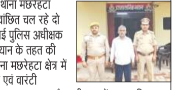
मोहल्ला छावनी थाना पुवायां बताया।