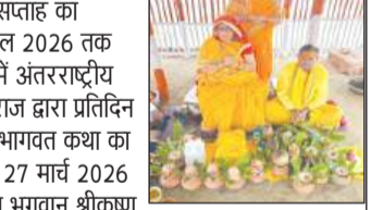
मोहल्ला छावनी थाना पुवायां बताया।