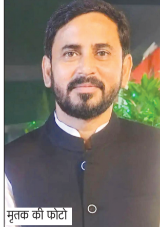
मृतक की फोटो

बुधवार दोपहर वह कार से चालक प्रदीप के साथ आफिस जाने के लिए निकले। मार्केट के सामने वह कार से उतरकर आफिस जा रहे थे। इस बीच नकाबपोश बदमाशों ने उनकी कार के आगे अपनी फिर् बाइक पर सवार होकर भाग निकले। चालक प्रदीप कार से नीचे उतरा और उसने शोर मचाया। आस पड़ोस के लोग जुट गए।