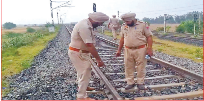
कैनविज टाइम्स संवाददाता

चंडीगढ़। पंजाब-हरियाणा बार्डर पर शंभू की सीमा में बीती रात दिल्ली-पटियाला रेलवे ट्रैक पर बम धमाका हुआ है। कहा जा रहा है कि जिस संदिग्ध ने विस्फोटक लगाया उसकी मौत हो गई। पुलिस ने शव के टुकड़े आज सुबह बरामद किए हैं। धमाके के कारण कई घंटे तक रेलवे ट्रैक बाधित रहा। यह धमाका पटियाला जिला के गांव बटोनियां के निकट जंगल में हुआ है। यहां रेलवे ट्रैक का कुछ हिस्सा घने जंगल में है। आतंकवाद के दौर में भी इस क्षेत्र में