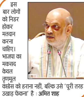
इस बार लोगों को निडर होकर मतदान करना चाहिए। भाजपा का मकसद केवल तुणमूल कांग्रेस को हराना नहीं, बल्कि उसे 'पूरी तरह उखाड़ फेंकना' है : अमित शाह