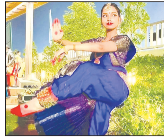
कैनविज टाइम्स संवाददाता

प्रत्येक वर्ष 29 अप्रैल को मनाया जाता है विश्व नृत्य दिवस