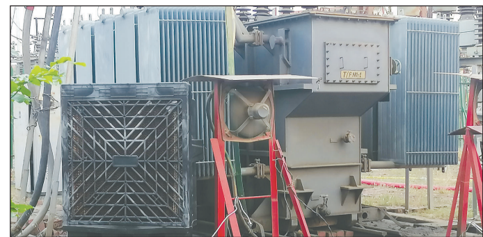
कैनविज टाइम्स संवाददाता

लखनऊ, चिनहट। राजधानी लखनऊ के चिनहट क्षेत्र स्थित शिवपुरी पावर हाउस में ट्रांसफार्मर को ठंडा रखने के लिए विशेष व्यवस्था की गई है। बढ़ती गर्मी को देखते हुए ट्रांसफार्मर के आसपास कूलर लगाए गए हैं, ताकि बिजली आपूर्ति सुचारु रूप से बनी रहे। बिजली आपूर्ति के अनुरूप, ट्रांसफार्मर के चारों ओर कुल चार कूलर लगाए गए हैं, जिससे तापमान नियंत्रित रखने में मदद मिल रही है। इससे ओवरहीटिंग की समस्या को कम