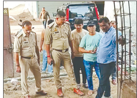
कैनविज टाइम्स संवाददाता

मोहनलालगंज, लखनऊ। मोहनलालगंज कस्बे में एक निर्माणाधीन मकान के बेसमेंट में गाय गिरने से हड़कंप मच गया। बताया जा रहा है कि गाय अचानक खुले पड़े बेसमेंट में जा गिरी और काफी देर तक बाहर नहीं निकल पाई, जिससे स्थानीय लोगों की भीड़ मौके पर जुट गई।