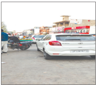
कैनविज टाइम्स संवाददाता

गोंडा । शहर में जाम की समस्या आम होती जा रही है। शहर में यातायात की अव्यवस्था से पूरे दिन लो ग जूझते रहते हैं। गुरुनानक चौक से सरकारी बस स्टॉप के दो सौ मीटर दूरी में भले ही दो पुलिस चौकी हो लेकिन इसका असर सड़कों पर नहीं दिखता है। सड़कों पर ही टैक्सियों के वाहन जमे रहते हैं और फिर जाम की स्थिति से लोगों की मुश्किलें बनी रहती हैं। इसी तरह एलबीएस चौराहे का भी हा ल है यहाँ यातायात व्यवस्था सुधारने में होमागई पूरे दिन हाफंते नजर आते हैं। उनके संकेतों को स मड़ने की फुर्सत वाहन चालकों को नहीं होती और जाम से दो-चार होना पड़ता है। शहर की यातायात व्यवस्था टैक्सियों वाहन चालकों की दबंगई की भेंट चढ़ गई है और यातायात पुलिस