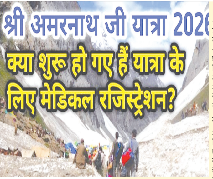
कैनविज टाइम्स संवाददाता

गोंडा । बाबा बर्फानी के दर्शन की चाह पूरी करने के लिए हेल्थ सर्टिफिकेट का होना अनिवार्य है। मगर श्रद्धालुओं के लिए यह सर्टिफिकेट बनवाना किसी अग्निपरीक्षा से कम नहीं है। कारण बाबू ईश्वर शर ण जिला चिकित्सालय में किसी भी डॉक्टर की ड्यूटी नहीं लगाई गई है। इसलिए सभी डॉक्टरों को अपने नियमित