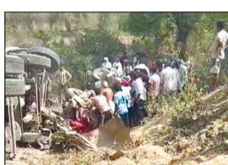
□ उन्नाव में बड़ा हादसा: मुंडन कराकर लौट रहा था परिवार, योगी का मुआवजे का प्लान

जानकारी के अनुसार, पठई गांव निवासी अल्पसंख्यक कल्याण विभाग के अधिकारियों की मिलीभगत से मानकों का पालन किए बिना सरकारी अनुदान प्राप्त कर रहे हैं तथा शिक्षित और कमीशन के माध्यम से अयोग्य शिक्षकों की नियुक्ति की जा रही है।