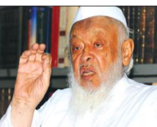
इस्लाम में कुर्बानी का कोई विकल्प नहीं है, यह एक धार्मिक कर्तव्य है जिसकी अदायगी हर सक्षम मुसलमान पर वाजिब है।

नई दिल्ली। ईद-उल-अजहा के मौके पर भारत के मुसलमानों के नाम अपने एक संदेश में जमीअत उलमा-ए-हिंद के अध्यक्ष मौलाना अरशद मदनी ने कहा है कि इस्लाम में कुर्बानी का कोई विकल्प नहीं है, यह एक धार्मिक कर्तव्य है जिसकी अदायगी हर सक्षम मुसलमान पर वाजिब है। इसलिए जिस व्यक्ति पर कुर्बानी वाजिब है, उसे हर हाल में यह फर्ज अदा करना चाहिए। इसके साथ ही उन्होंने वर्तमान हालात के मद्देनजर मुसलमानों से कई तरह की सावधानी बरतने की भी अपील की है। मौलाना मदनी ने यह भी सलाह दी कि मुसलमान कुर्बानी करते समय सरकार द्वारा जारी दिशा-निर्देशों का पूरी तरह पालन करें। प्रतिबंधित जानवरों की कुर्बानी से बचें। चूंकि, धर्म में इसके बदले काले जानवर की कुर्बानी भी जायज है, इसलिए किसी भी फसाद से बचने के लिए उसी पर इतिफाक (संतोष) करना बेहतर होगा। उन्होंने यह भी कहा कि अगर किसी जगह