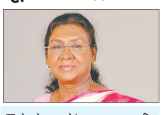
□ खेल केवल मनोरंजन का माध्यम नहीं है, बल्कि यह सामाजिक समरसता, टीम भावना और आत्मविश्वास को भी विकसित करता है।

नई दिल्ली। राष्ट्रपति द्रौपदी मुर्मु ने देश के युवाओं, विशेषकर जनजातीय समुदाय के प्रतिभाशाली खिलाड़ियों को राष्ट्र की अमूल्य सामाजिक पूंजी बताते हुए उन्हें खेलों में सक्रिय भागीदारी और उत्कृष्टता की दिशा में आगे बढ़ने का आह्वान किया है। एक लेख के माध्यम से अपने विचार साझा करते हुए राष्ट्रपति ने कहा कि भारत के ग्रामीण और वन क्षेत्रों में मौजूद प्राकृतिक प्रतिभा को उचित प्रशिक्षण और संसाधनों के जरिए निखारकर देश खेल जगत में नए कीर्तिमान स्थापित कर सकता है। राष्ट्रपति ने जनजातीय क्षेत्रों के बच्चों की सहज खेल प्रतिभा का उल्लेख करते हुए कहा कि ये बच्चे सीमित संसाधनों के बावजूद प्रकृति के बीच अपने खेल संसार का निर्माण कर लेते हैं। मिट्टी, पेड़ों, बीजों और अन्य प्राकृतिक वस्तुओं का उपयोग करके वे खेल के साधन तैयार करते हैं और पूरे उत्साह के साथ खेलते हैं। उन्होंने कहा कि यह स्वाभाविक रूझान और ऊर्जा यदि आधुनिक प्रशिक्षण और