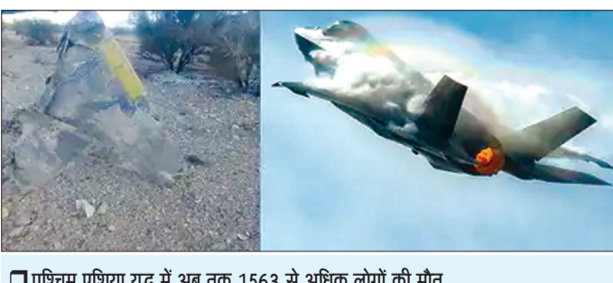
□ पश्चिम एशिया युद्ध में अब तक 1563 से अधिक लोगों की मौत

तेहरान । पश्चिम एशिया में 35 दिनों से जारी युद्ध के बीच ईरान ने अपने मध्य हवाई क्षेत्र में अमेरिका के एफ-35 समेत दो लड़ाकू विमानों को मार गिराया का दावा किया है। इसके पहले भी ईरानी सेना ने एक एफ-35 विमान को मार गिराया था। ईरान के प्रेसईडी और तसनीम न्यूज एजेंसी के मुताबिक इस्लामिक रिवोल्यूशनरी गार्ड्स कॉर्प्स (आईआरजीसी) ने अमेरिका के इन दो विमानों को मार गिराने का दावा ऐसे समय में किया है जब डोनाल्ड ट्रंप ने हाल ही में ईरान की वायु रक्षा प्रणाली को नष्ट करने की बात कही थी। हालांकि, इस दावे पर अभी तक अमेरिकी रक्षा विभाग की ओर से कोई प्रतिक्रिया सामने नहीं आई है। आईआरजीसी के अनुसार 28 फरवरी से शुरू हुए इस युद्ध में अब तक अमेरिका के दो एफ-35, एक