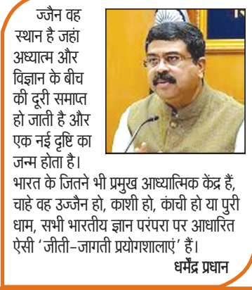
जैतन वह स्थान है जहां अध्यात्म और विज्ञान के बीच की दूरी समाप्त हो जाती है और एक नई दृष्टि का जन्म होता है। भारत के जितने भी प्रमुख आध्यात्मिक केंद्र हैं, चाहे वह उज्जैन हो, काशी हो, कांची हो या पुरी धाम, सभी भारतीय ज्ञान परंपरा पर आधारित ऐसी 'जीती-जागती प्रयोगशालाएं' हैं। धर्मप्रधान

वर्ष-15 अंक-64 शनिवार, 04 अप्रैल 2026 नगर संस्करण लखनऊ से प्रकाशित एवं दिल्ली, पंजाब और उत्तराखंड में प्रसारित मूल्य- ₹ 3.00 पृष्ठ-12 सिर्फ सच