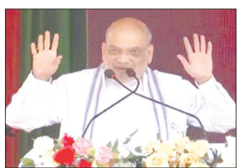
सीटों पर भाजपा प्रत्याशियों के पक्ष में मतदान करने की अपील की। कांग्रेस पर निशाना साधते हुए शाह ने आरोप लगाया कि कांग्रेस ने अपने शासनकाल में असम को अशांत बनाए रखा और राज्य की संस्कृति के संरक्षण के लिए कोई ठोस कार्य नहीं किया। इसके विपरीत, उन्होंने कहा कि भाजपा असम की समृद्ध