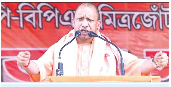
□ उन्होंने कहा कि कांग्रेस चुनाव के पहले ही मैदान छोड़कर भाग गई, जबकि एआईयूडीएफ को भी बंगाल की खाड़ी में फेंकने का समय आ गया है

उन्होंने असमवासियों से एक बार फिर भारतीय जनता पार्टी (भाजपा) की सरकार बनाने का आह्वान किया और कहा कि चुसपैठियों को बाहर करना है और असम की डेमोग्राफी को बदलने नहीं देना है। राजग का संकल्प है कि असम को लव जेहाद-लैंड जेहाद की धरती नहीं बनने देंगे। यहां चुसपैठ नहीं होने देंगे। कांग्रेस व यूडीएफ की चुसपैठियों के जरिये डेमोग्राफी बदलने की साजिश सफल नहीं होने देंगे। एक-एक चुसपैठी को चिह्नित कर यहां से बाहर करने की भी व्यवस्था हो रही है। मुख्यमंत्री योगी ने कहा कि डबल इंजन सरकार ने तय किया है कि असम को चुसपैठ का अड्डा नहीं बनने देंगे और दंगाइयों को निकाल बाहर करेंगे। कांग्रेस एवं एआईयूडीएफ को जब भी अवसर मिला, इन्होंने भारत व भारतीयता को