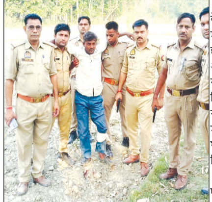
केनविज टाइम्स संवाददाता

पुलिस की जवाबी कार्रवाई में बादभाश के पैर में लगी गोली