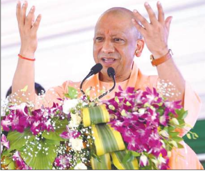
जाति के नाम पर बांटने वाले, प्रदेश को दंगों की आग में झोंकने वाले नहीं करा सकते विकास : सीएम योगी

गीडा के प्लास्टिक पार्क में उपस्थित जनसमूह को संबोधित करते हुए मुख्यमंत्री ने कहा कि गोरखपुर, पूर्वी उत्तर प्रदेश और