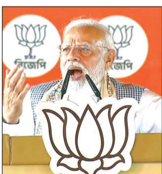
प्रधानमंत्री ने पश्चिम बंगाल के चुनाव प्रचार में महिलाओं की सुरक्षा, महिला आरक्षण का मुद्दा उठाया

कोलकाता। पश्चिम बंगाल के कूचबिहार में प्रधानमंत्री नरेंद्र मोदी ने एक बड़ी चुनावी रैली को संबोधित किया। उन्होंने कहा कि कूचबिहार में उमड़ा यह जनसेलाब नए बंगाल और भाजपा सरकार के प्रति जनता के अटूट विश्वास का प्रतीक है। प्रधानमंत्री ने टीएमसी पर कड़ा प्रहार किया और महिलाओं के लिए अपनी सरकार की योजनाओं का भी जिक्र किया। प्रधानमंत्री ने कहा, वह पहले भी इस मैदान पर आए हैं, लेकिन आज की भीड़ ने पुराने सभी रिकॉर्ड तोड़ दिए हैं। यह उत्साह एक उज्ज्वल भविष्य और नए बंगाल के निर्माण का संकेत है।