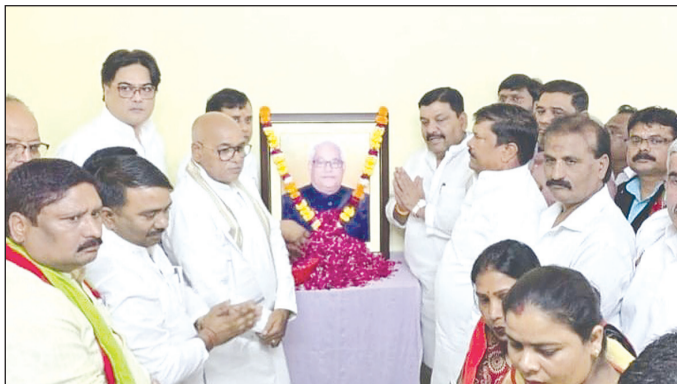
कैनविज टाइम्स संवाददाता

जिससे आमजन और आसपास के दुकानदार भी परेशान हैं।