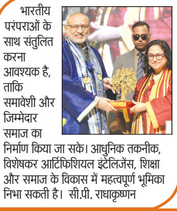
भारतीय परंपराओं के साथ संतुलित करना आवश्यक है, ताकि समावेशी और जिम्मेदार समाज का निर्माण किया जा सके। आधुनिक तकनीक, विशेषकर आर्टिफिशियल इंटेलिजेंस, शिक्षा और समाज के विकास में महत्वपूर्ण भूमिका निभा सकती है। सी.पी. राधाकृष्णन

पाकिस्तान कितने टुकड़ों में बंटेगा, भगवान ही जाने : राजनाथ 11